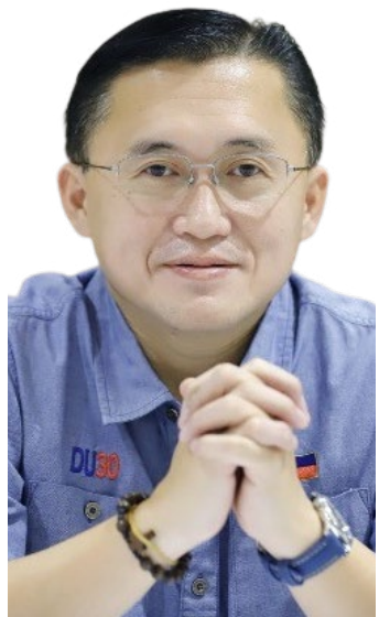
Si Senador Christopher Go.

Ayon kay Go kailangang lalo pang pagbutihin at palawakin ang mga programa sa kalusugang pangkaisipan.