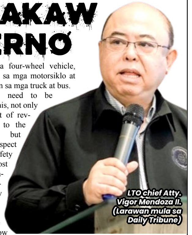
LTO Chief Atty. Vigor Mendoza II.

Batay sa LTO database, ang National Capital Region ang may pinakamataas na bilang ng mga delinquent motor vehicle owner sa napatalang 4.1 milyon, kasunod ang